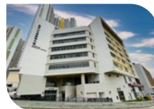
皇后山綜合服務中心

※ 位於粉嶺皇后山邨的皇后山綜合服務中心已完成裝修，並於2023年4月1日正式使用。