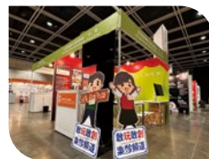
香港社會服務巡禮2023

※ 於2月15日參加香港社會服務聯會舉辦之「香港社會服務巡禮2023」，分別介紹青少年及長者以拍攝為主的創新服務計劃。