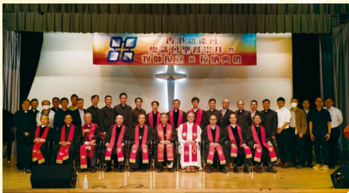
主禮團、本會眾牧師與被按立接納牧師合照

香港路德會總議會每年定期舉行，旨在討論香港路德會的各项事務和未來發展計劃。此次總議會共議決了多項重要事項，相信能夠有助於香港路德會更好地發展和服務信徒。