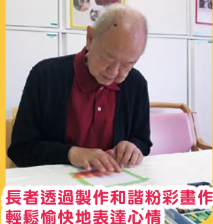
長者透過製作和諧粉彩畫作 輕鬆愉快地表達心情

此外，利用「耆年日間護理中心及耆年院舍組」跨專業設計的「心靈喜動」教材套，結合院舍日常活動，透過 T: Think Positive(正向思維)、E: Exercise(運動)、L: Learn(培養嗜好)、L: Live healthy(健康生活)為本，推廣正向思維，從而促進精神健康。院舍每週會分享正向主題，鼓勵院友完成「心靈喜動」教材套的指定任務，增加社交互動關愛彼此。