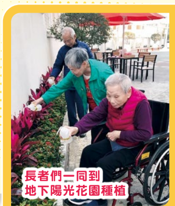
長者們一同到 地下陽光花園種植

計劃下其中的一個重點活動「陽光花園伴你遊」，讓院友接觸戶外，透過觀賞及栽種自己親自挑選的植物，增加長者的生活滿足感之餘，亦可從植物的盛衰枯榮中得到啟發，回顧人生，積極享受生活，數算主恩。