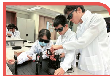
學生進行中科院光學實驗