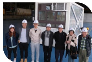
過渡性房屋項目團隊參觀示範單位

※ 兩個過渡性房屋項目「七星薈」及「雙魚薈」建築工程正如火如荼進行，並即將啟動招攬住客申請程序。