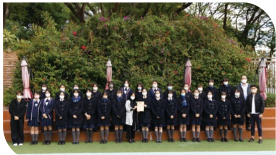
香港及海外賽區中學合唱組冠軍