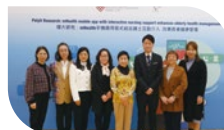
長者中心組與理大團隊合照

※ 長者中心組聯同香港理工大學於3月2日舉行記者會，發佈「mHealth手機應用程式結合護士互動介入」研究。