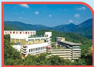
香港國際學校為頂級國際學校