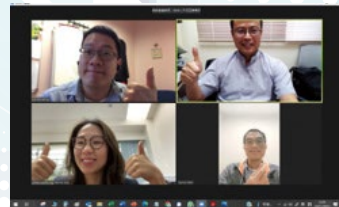
2022 年疫情中， 九龍東區代表線上會議

九龍東區聯繫小組成立後，已舉行兩次會議。大家都同意增加各單位透明度，了解各代表的聯區工作，未來將建立更多區內堂會、學校及社會服務的認識，並規劃相應活動，促進交流和合作。區小組整理了部份單位的聯結工作成為簡報，讓區內同工們加深了解，以計劃將來的發展。簡報如下：