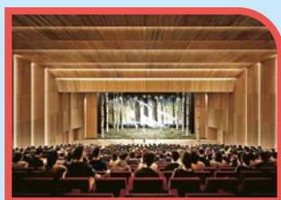
深圳南山協同港人子弟學校，提供國際級校園設備