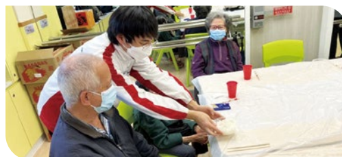
茜草灣長者中心長者與馬中學生聚會

駐校堂會路德會沐恩堂與國民教育組合作，以往於聖誕節前夕到院舍舉辦聯歡與敬拜活動，但因疫情限制而改以直播／錄播方式舉行。約 10 位學生錄製聖誕詩歌，由黃信榮牧師和教士帶領，於安老院聖誕聯歡會上播放，讓院舍的長者感受到節日的歡樂和關懷。