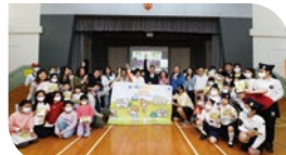
家+童心健樂行2023啟步禮

※ 於3月18至26日舉行的年度步行籌款活動「家+童心健樂行2023」已完滿結束，感謝本會學校及各界踴躍支持。