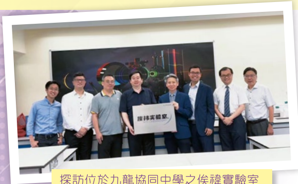
探訪位於九龍協同中學之俟禕實驗室