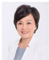
香港教育局局長蔡若蓮 為南山中英文港籍學生班題字祝賀

路德會協同教育集團自2011年起已在國內推動教育工作，在內地有十多年辦學經驗的香港路德會會長戎子由博士表示，在大灣區設校有其迫切需要，「隨著大灣區持續蓬勃發展，港人北上到大灣區發展及就業的數目只會愈來愈多，現時估計有多達四萬名適齡香港學生，分佈於大灣區不同城市，港人子弟學校的設立，正好解決他們的需要，提供以香港教育局核準的課程框架，符合居於內地的港人子女的學習需要，減少學童因轉校的不適應，也便利他們日後回港升學，讓他們可以無縫地銜接本地課程，再不需要舟車勞頓往返內地及香港讀書。另一方面，香港面對人口萎縮問題，出生率一直處於偏低水平，去年香港出生人數只有3.25萬，現時情況是本地約5.7萬位教師面對約65萬中小學學童，但未來隨著出生率進一步下降，教師數目有機會出現過剩的情況，變相是資源錯配，浪費了花在教育方面的公帑，在大灣區成立港人子弟學校正好提供更多就業機會予本地教師，將資源更好地調動到整個灣區使用；這也正好吻合大灣區所倡議互動合作，優勢互補，並尋求進步的精神，香港路德會從事教育及社會關懷工作逾七十載，義不容辭憑藉自身專業、經驗、品牌及全球網絡，積極推進大灣區的教育工作。」