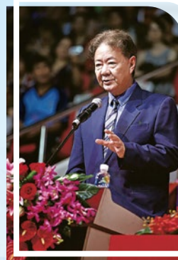
香港路德會會長戎子由博士表示，港人子弟學校的設立，解決大灣區港人的需要，並提升灣區整體價值