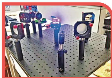
路德會引入中科院光學設備教學