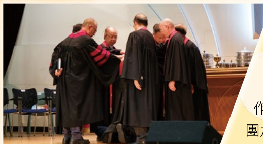
主禮團進行按立禮

在報告部分，各堂及佈道所、各院校、各委員會及工作單位均進行了報告。此外，會長也進行了報告，指出香港路德會的最新動向和未來發展計劃：就是教育要宏觀，社服新領域，六區能整合。所有報告案都獲得了通過。