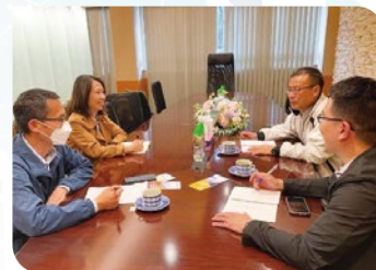
2023 年， 代表實體相見，共襄聖工

每年路德會馬錦明慈善基金馬陳端喜紀念中學的德育、公民及國民教育組（下稱國民教育組）都安排全級中四學生，參與三小時的服務學習基礎訓練課程，讓學生認識社會服務與學習的關係，接觸福利政策，分析弱勢社群需求，並教導籌辦各項活動的技巧。上學期有 78 位學生參與。